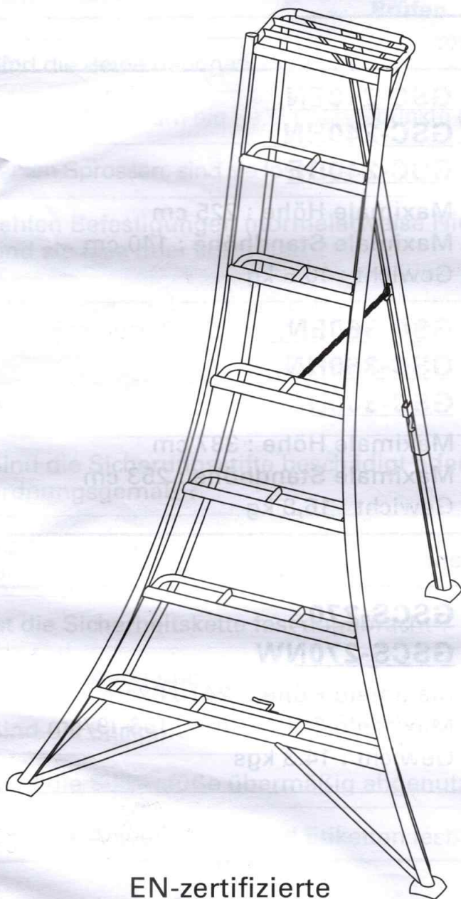
EN-zertifizierte Stativleiter (GSC-Modelle)

GSC-EN, HN, DE Models GSCS, GSCS-NW Models